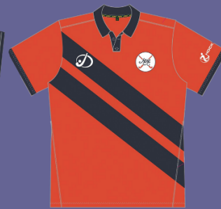
THUISTENUE MAN / VROUW / KIDS